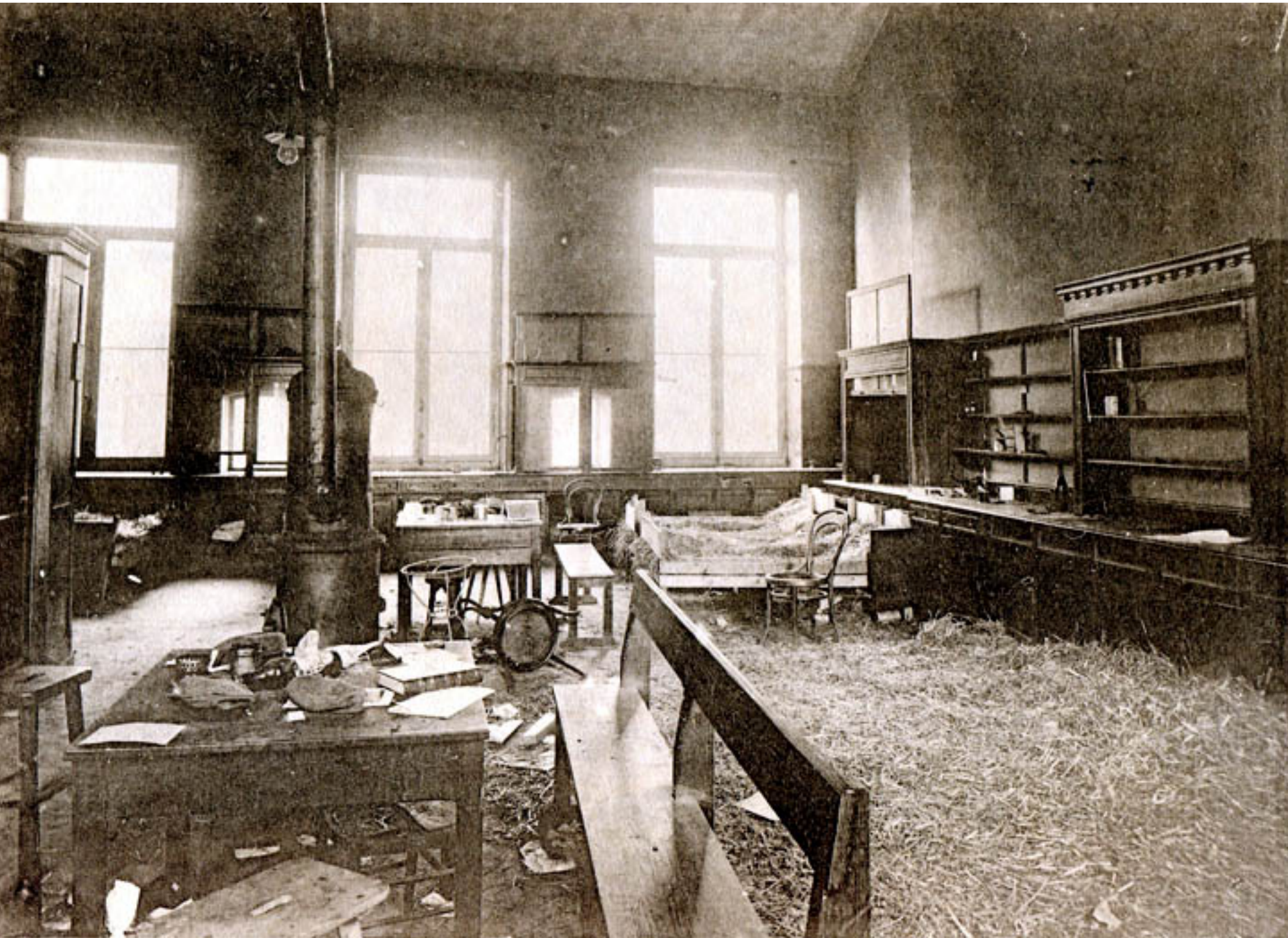
Laboratoire de Chimie industrielle, novembre 1918. On distingue encore la paille au sol.

le couloir qui y donnait accès furent transformés en écurie. Dans les salles des livres, les soldats allemands étalèrent des bottes de paille en guise de couchage.