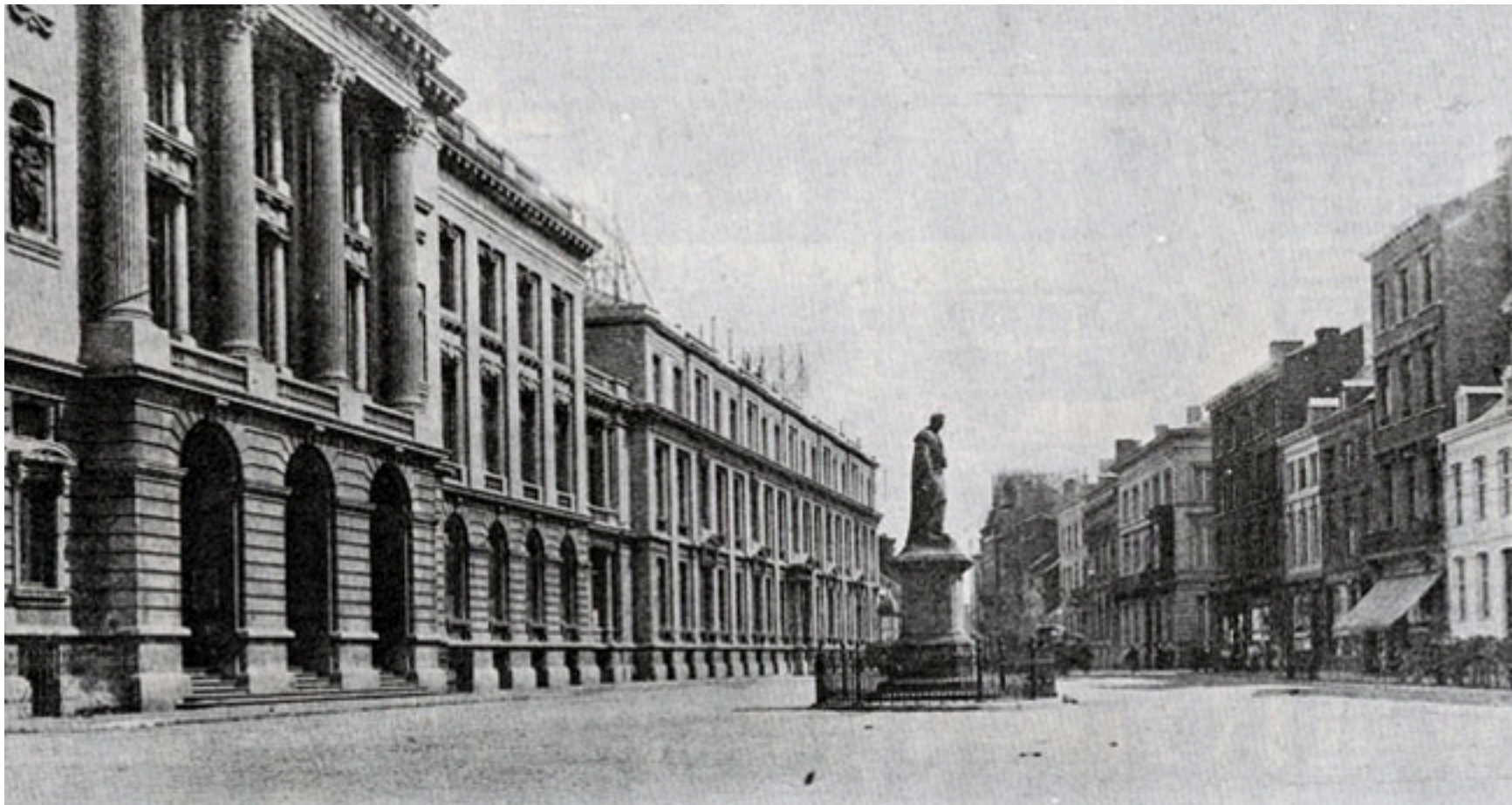
Place de l'Université, avant 1914. Sur la droite, on voit à gauche, l'Université et à droite, l'ancien bâtiment de l'Émulation

Dès les premiers jours de la guerre, les bâtiments de l'Université sont occupés par les soldats Allemands, qui font bien peu de cas des bâtiments et de leur contenu. L'Université aura à subir de nombreuses pertes humaines et matérielles. Une plaque commémorative du massacre du 20 août, apposée sur sa façade, et un monument à la mémoire des étudiants et du personnel morts à la guerre perpétuent le souvenir de ces années tragiques.