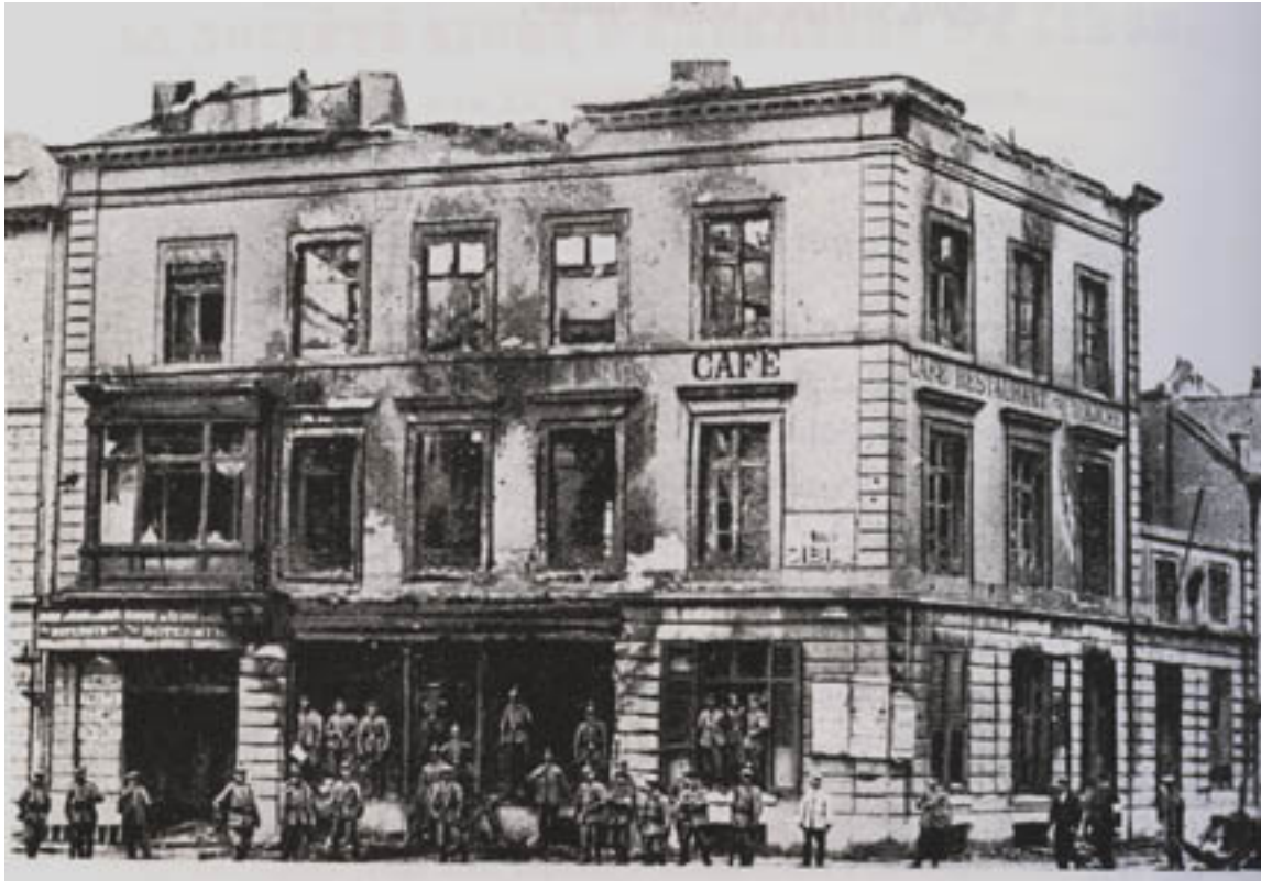
Bâtiment du café-restaurant de M.Jonet, entre la rue de l'Université et la place Cockerill incendié le 20 août.

Dans le chaos général, une douzaine de soldats allemands furent atteints par les balles de leurs camarades. On eût dit que les soldats allemands étaient atteints d'une véritable hystérie collective puisque la fusillade se propagea ensuite dans plusieurs quartiers de la ville. L'artillerie elle-même s'en mêla. Imaginant une attaque ennemie depuis la rive gauche, un canon établi sur la rive droite au quai des Pêcheurs - l'actuel quai Van Beneden - bombarde les immeubles du quai sur Meuse, éventrant cinq maisons.